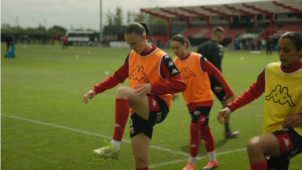
Photogrammes tirés du film