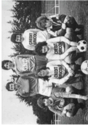
Photo extraite du film « Championnes ! » de Morgane Lincy-Fercot.