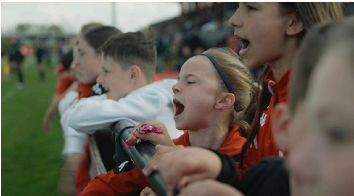
Photogrammes tirés du film