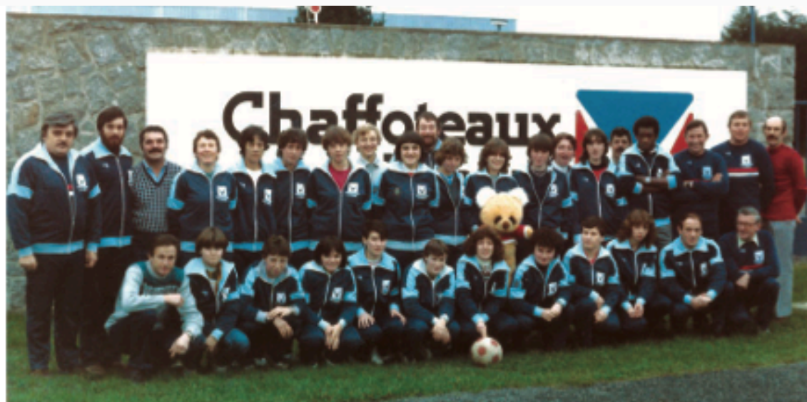
Une des générations de Chaffoteaux. Soudées et pleines d'énergie, ces femmes ont vécu une incroyable aventure sur deux décennies.