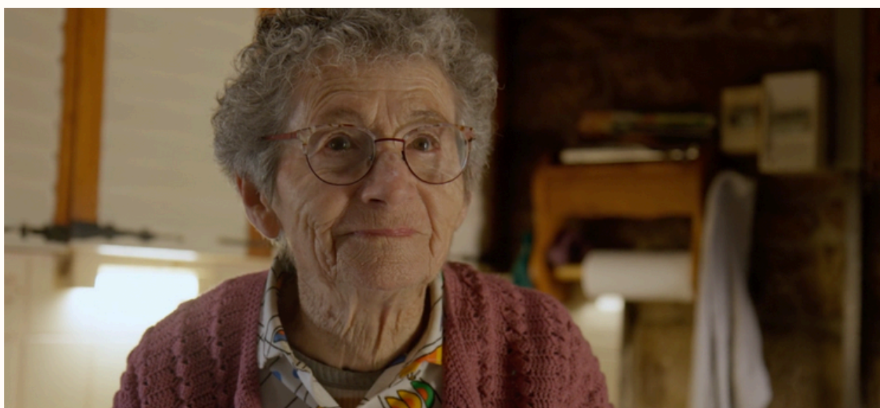
Madame Lulu (2022)