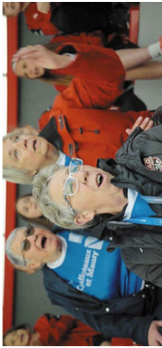
Photo extraite du film « Championnes ! » de Morgane Lincy-Fercot.